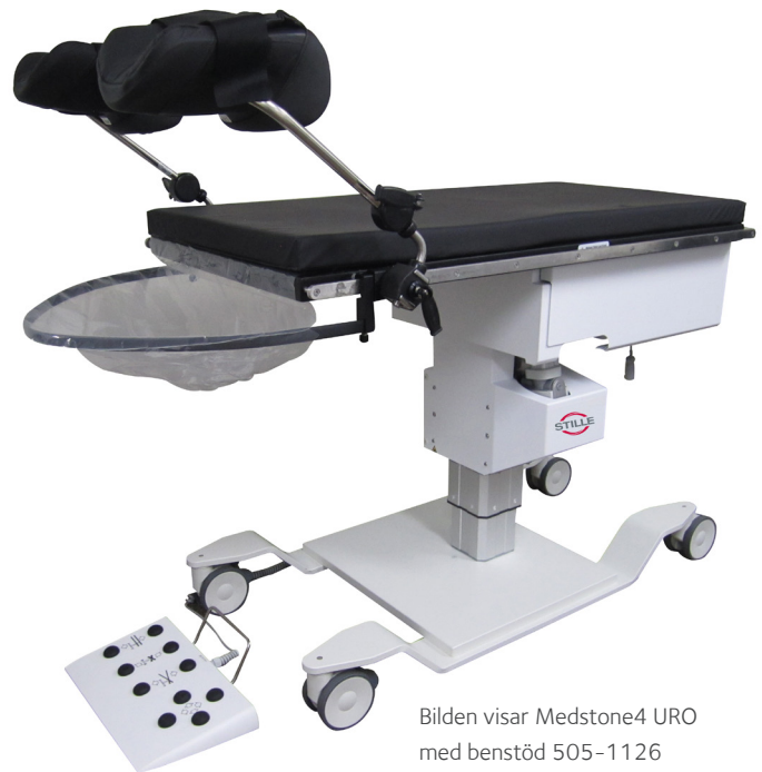
Bilden visar Medstone4 URO med benstöd 505-1126