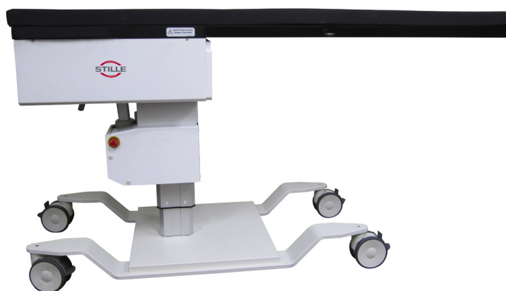
Bilden visar Medstone5 ERCP (500-1031) utan sidoskenor.