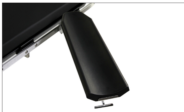
514-50-3SR025 verstellbare Armauflage mit Polster