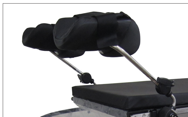
505-1126 Beinhalter Goepel (Paar)