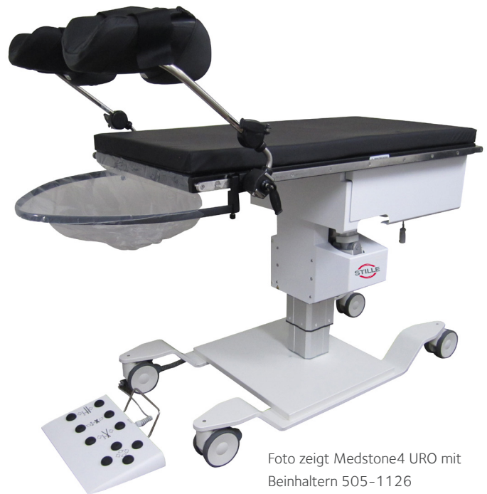
Foto zeigt Medstone4 URO mit Beinhaltern 505-1126