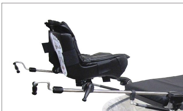
505-1114 Beinhalter mit Gasfederunterstützung (Paar)