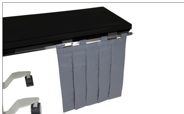
535-1772 Strahlenschutzvorhang grau