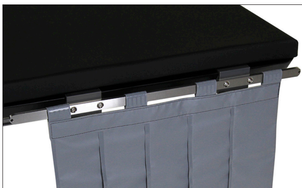
505-1181 Abnehmbare Seitenschienen (Paar)

*Zubehör zur Anbringung an den 2 abnehmbaren Seitenschienen 505-1181