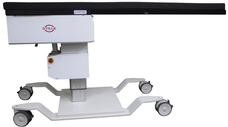
Afbeelding van Medstone 5ERCP (500-1031).