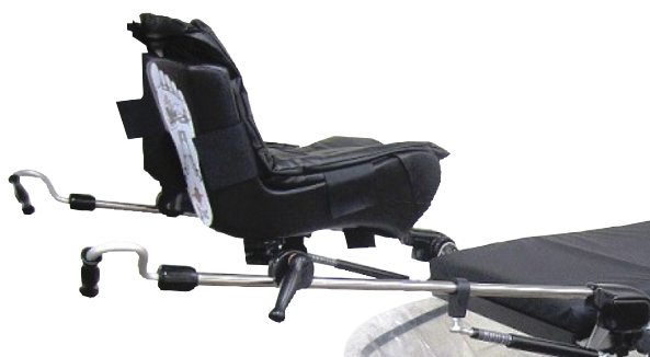
505-1114 Beenhouders met gasveersteun (paar)