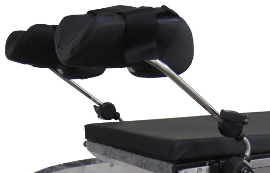
505-1126 Beenhouders Goepel (paar)