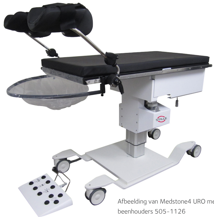
Afbeelding van Medstone4 URO met beenhouders 505-1126