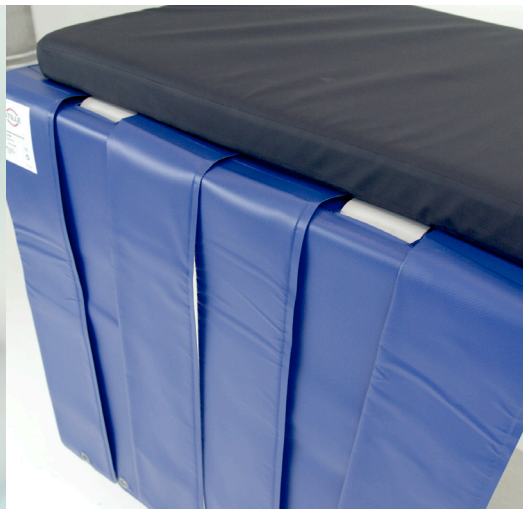
Kit de protección contra rayos X (6 paneles individuales) disponible en gris (535-1770) y azul (535-1771)