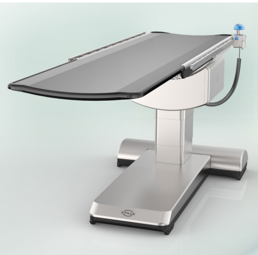
STILLE imagiQ2 mesa quirúrgica de imágenes

La frecuencia de los procedimientos intervencionistas guiados por imágenes continúa y aumenta la necesidad de tecnologías y protecciones contra la radiación a bajas dosis.