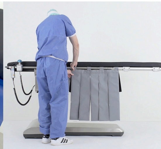
Circuito protector de rayos X (5 paneles conectados) disponible en gris (535-1772) y azul (535-1773)